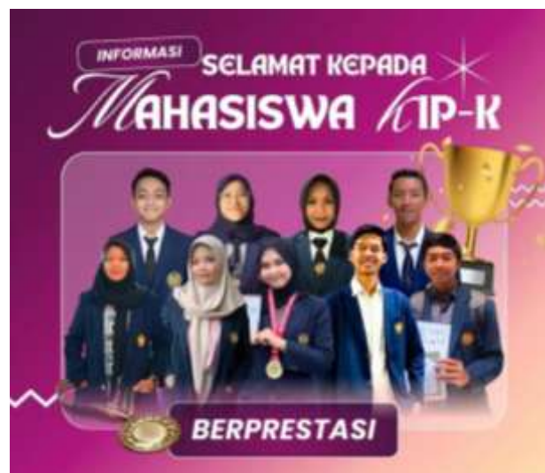
Gambar 4. Mahasiswa penerima Program KIP-K Universitas Negeri Surabaya yang berprestasi dalam kegiatan akademik dan nonakademik