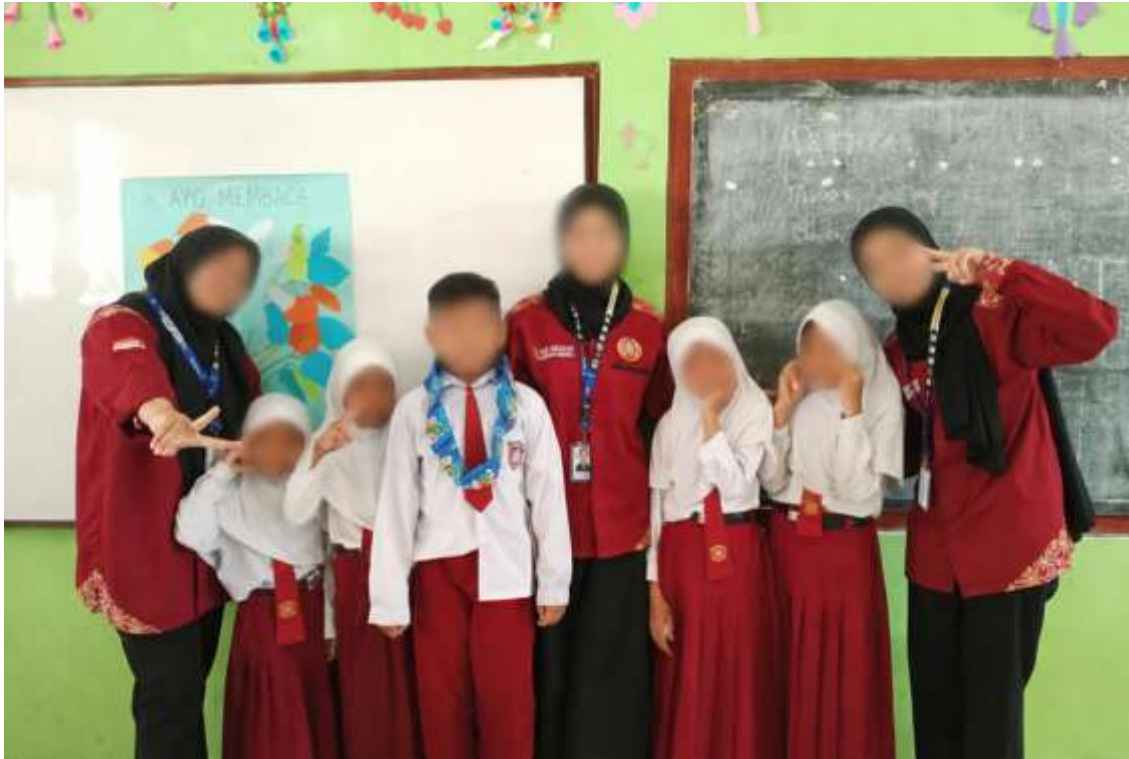
Gambar 6. Partisipasi mahasiswa penerima Program KIP-K dalam kegiatan pengabdian masyarakat sebagai bentuk dampak sosial program

dasar pendidikan dapat terpenuhi dengan lebih baik. Selain pada aspek pendidikan, Program KIP-K juga memberikan dampak sosial bagi mahasiswa penerima bantuan. Mahasiswa memiliki kesempatan yang lebih besar untuk mengikuti kegiatan organisasi, pengembangan diri, dan aktivitas akademik lainnya tanpa terlalu terbebani persoalan biaya pendidikan.