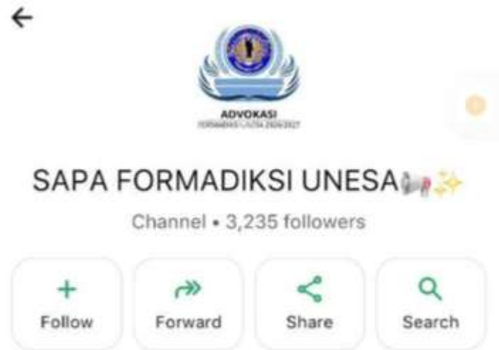
Gambar 5. Saluran informasi Program KIP-K melalui media komunikasi FORMADIKSI Universitas Negeri Surabaya