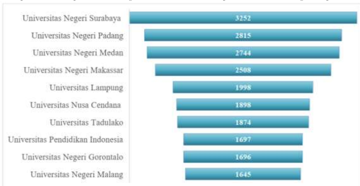
Gambar 2. Daftar PTN penerima KIP Kuliah terbanyak jalur SNBT 2025