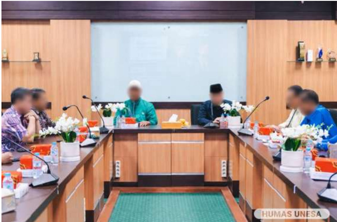
Gambar 3. Pertemuan Universitas Negeri Surabaya dan Komisi X DPR RI dalam pembahasan mekanisme penyaluran Program KIP-K

memastikan mahasiswa tetap aktif dan memenuhi persyaratan program. Mekanisme tersebut menunjukkan bahwa pelaksanaan Program KIP-K tidak berjalan secara terpisah, tetapi terintegrasi dengan sistem pembinaan akademik dan kemahasiswaan di lingkungan universitas. Dari aspek eksternal, Program KIP-K di Universitas Negeri Surabaya telah berjalan selaras dengan kebijakan pemerintah dalam meningkatkan pemerataan akses pendidikan tinggi bagi masyarakat kurang mampu. Pelaksanaan program juga menunjukkan adanya hubungan koordinatif antara perguruan tinggi dengan pemerintah pusat dalam proses evaluasi dan pengawasan program.