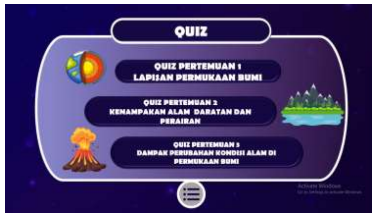
Gambar 5. Tampilan Evaluasi/Kuis Interaktif (Tahap Implementation)

Uji coba dilaksanakan melalui tiga tahap: (1) one-to-one: media dicoba oleh 1 guru, diperoleh masukan awal terkait kemudahan navigasi; (2) small group: angket kepraktisan diberikan kepada 1 guru dan 10 siswa kelas V (5 berkemampuan akademik tinggi, 5 rendah); dan (3) pilot test: angket respon diberikan kepada 1 guru dan 15 siswa kelas IV.