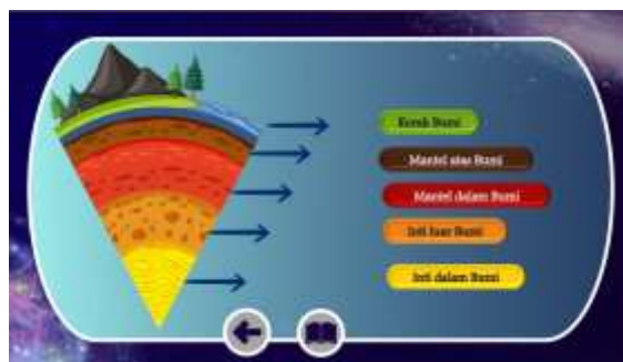
Gambar 2. Materi Lapisan Permukaan Bumi

Gambar 1 merupakan hasil desain tampilan awal MEDIMUMI yang menunjukkan menu utama dengan ikon-ikon interaktif. Tampilan ini berfungsi sebagai pintu masuk bagi siswa untuk memilih materi pembelajaran sesuai topik yang ingin dipelajari. Navigasi dirancang sederhana dengan ikon visual sehingga dapat digunakan siswa tanpa kesulitan. Tujuan utama desain ini ialah memberikan pengalaman pertama yang menyenangkan sekaligus mudah diakses.