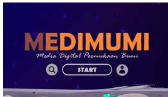
Gambar 1. Tampilan Awal Media

Tahap desain bertujuan merancang struktur, tampilan, dan alur navigasi MEDIMUMI. Media dirancang berbasis PowerPoint interaktif dengan elemen teks, gambar, animasi, ikon navigasi (Beranda, Lanjut, Kembali, Mulai), dan video edukatif. Warna cerah dan ilustrasi dipilih sesuai karakteristik siswa SD tanpa mengalihkan perhatian dari isi materi. Bahasa disederhanakan tanpa mengurangi substansi. Kerangka slide mencakup: judul, menu utama, petunjuk penggunaan, profil pencipta, tujuan pembelajaran, dan penyajian tiga submateri (lapisan permukaan bumi, kenampakan alam daratan dan perairan, serta dampak perubahan kondisi alam), diakhiri kuis interaktif dan kesimpulan.